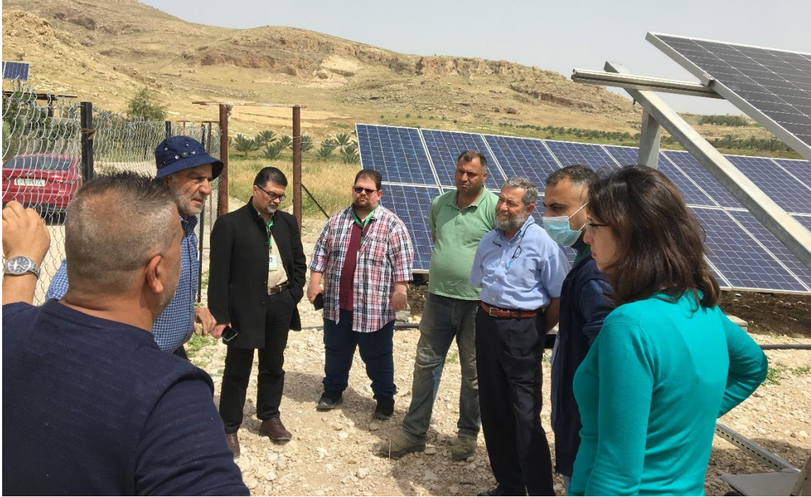
فريق أوكسفام و ESDC في زيارة ميدانية لمشروع نظام إخزوق موسى الشمسي